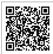
Set für USB-Anschluss