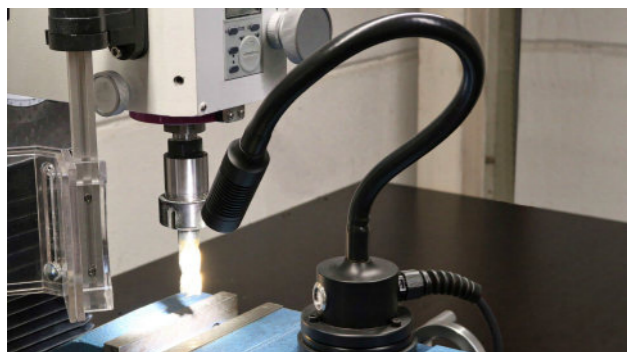
Anwendungsbeispiel: Fräsmaschine Application example: milling machine

Optimum lighting conditions are ensured by a compact aluminum luminaire body. The LEDs guarantee a perfect illumination of different applications with 428 lm and a beam angle of 18 ° or 40 °. The neutral light color of 5,000 K ensures pleasant working and a switch on the lamp base increases comfort.