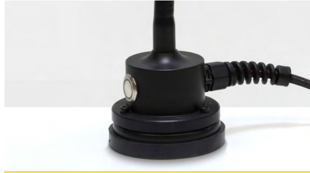
Stabiler Standfuß mit integriertem Schalter Stable base with integrated switch