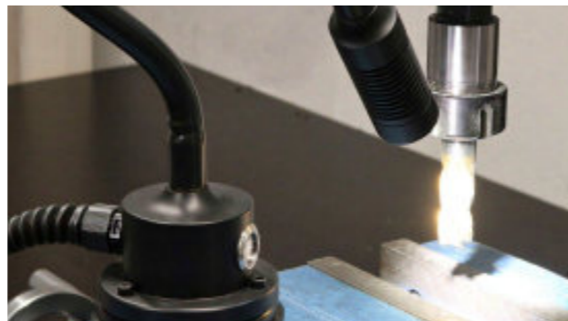
Präzise Ausleuchtung des Arbeitsplatzes Precise illumination of the workplace